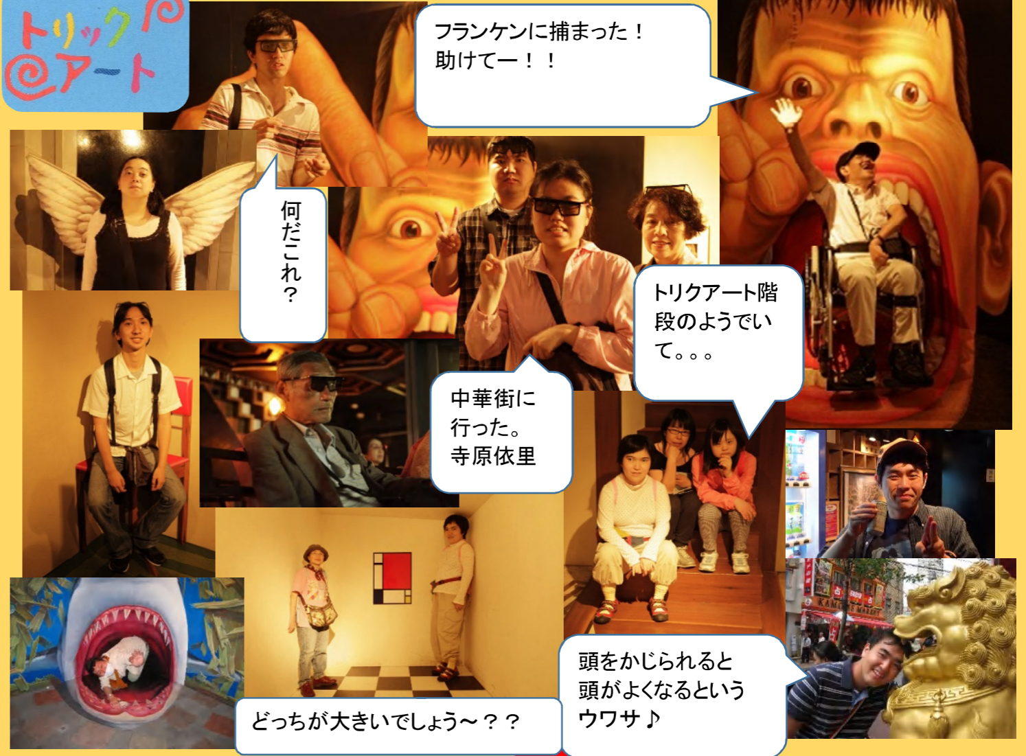
フランケンに捕まった! 助けてー!!